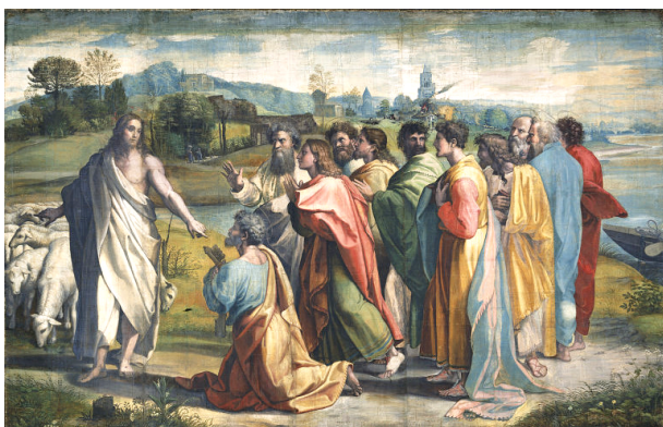
<베드로에게 양 떼를 맡기시는 예수님>, 라파엘로 산치오

예수님께서 세 번째로 베드로에게 물으셨다. “요한의 아들 시몬아, 너는 나를 사랑하느냐?” 베드로는 예수님께서 세 번이나 “나를 사랑하느냐?” 하고 물으시므로 슬퍼하며 대답하였다. “주님, 주님께서서는 모든 것을 아십니다. 제가 주님을 사랑하는 줄을 주님께서서는 알고 계십니다.” 그러자 예수님께서 베드로에게 말씀하셨다. “내 양들을 돌보아라.”(요한 21,17)