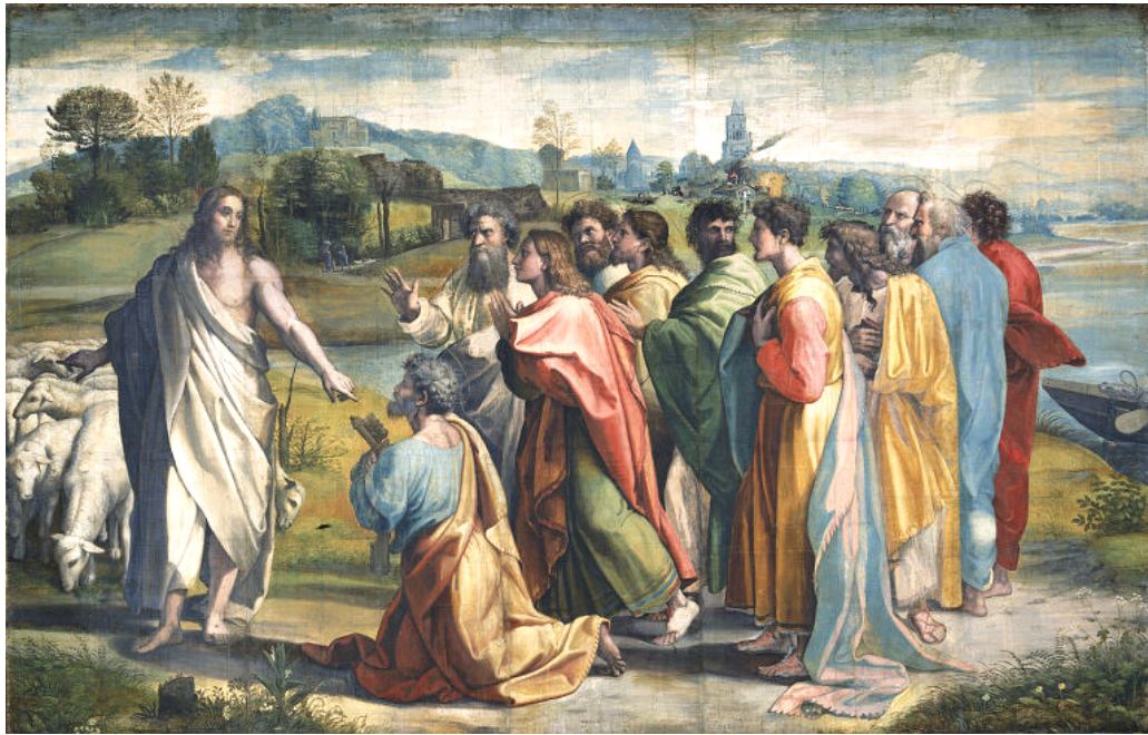
<베드로에게 양 떼를 맡기시는 예수님>, 라파엘로 산치오

그러자 예수님께서 베드로에게 말씀하셨다. “내 양들을 돌보아라.” (요한 21,17)