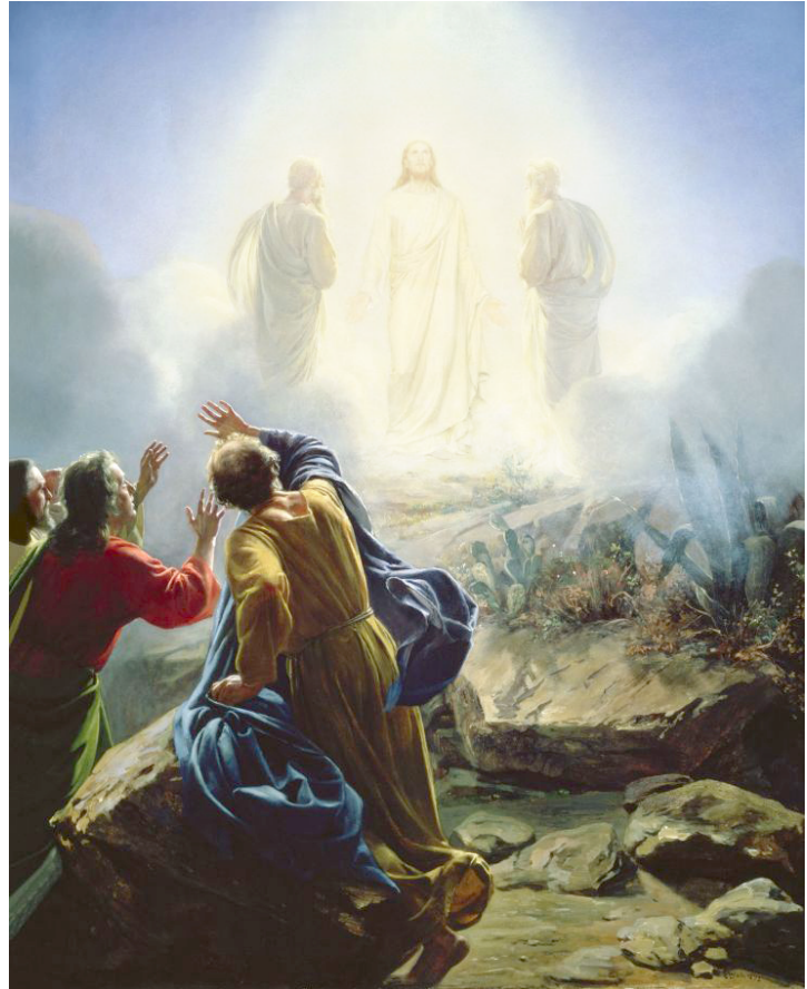
〈거룩한 변모〉, 칼 하인리히 블로흐

“그때에 예수님께서 베드로와 요한과 야고보를 데리고 기도하시러 산에 오르셨다. 예수님께서 기도하시는데, 그 얼굴 모습이 달라지고 의복은 하얗게 번쩍였다. 그리고 두 사람이 예수님과 이야기를 나누고 있었다. 그들은 모세와 엘리야였다” (루카 9,28-30)