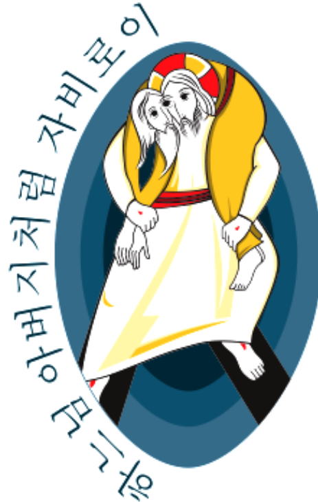
〈자비의 희년 로고〉

“너희 아버지께서 자비하신 것처럼 너희도 자비로운 사람이 되어라. 남을 심판하지 마라. 그러면 너희도 심판받지 않을 것이다. 남을 단죄하지 마라. 그러면 너희도 단죄받지 않을 것이다. 용서하여라. 그러면 너희도 용서받을 것이다.” (루카 6,36-37)