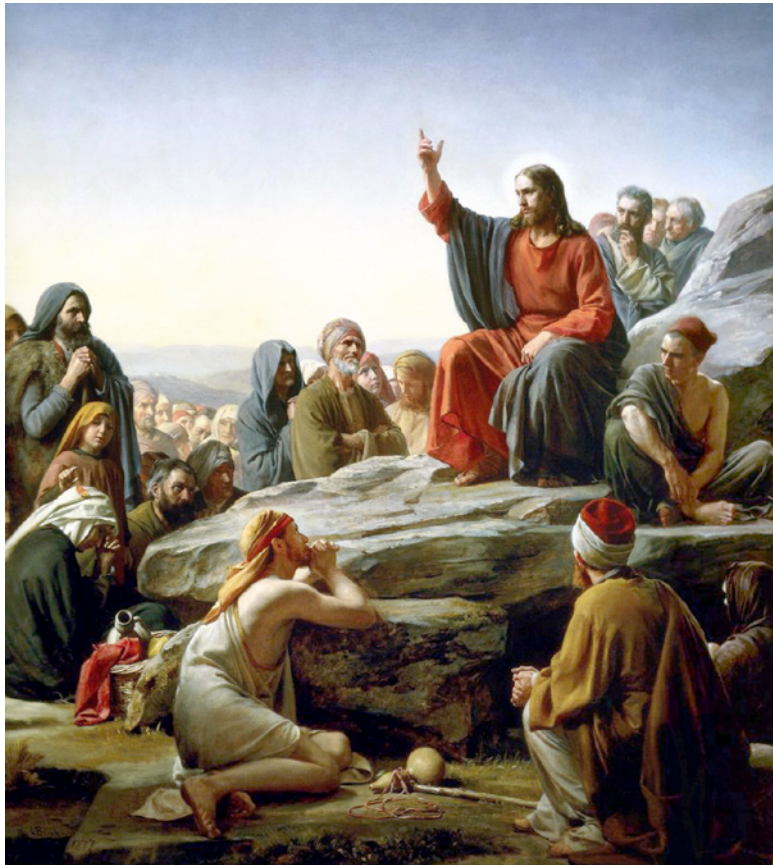
〈산상설교〉, 칼 하인리히 블로흐