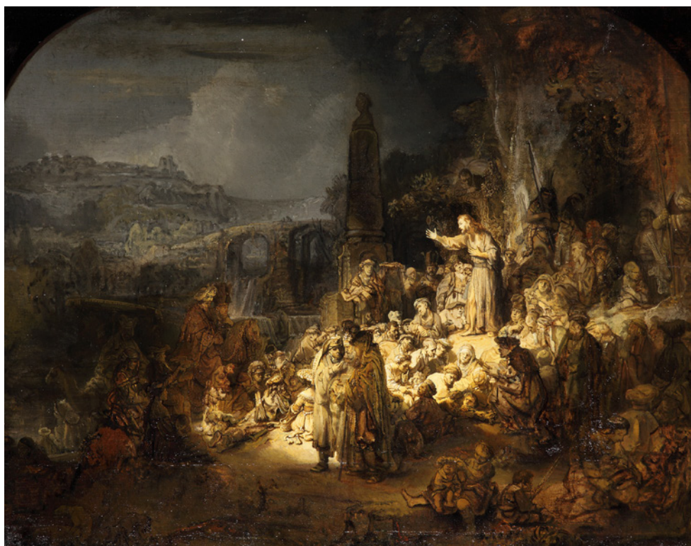
〈세례자 요한의 설교〉, 렘브란트

“광야에서 외치는 이의 소리. ‘너희는 주님의 길을 마련하여라. 그분의 길을 곧게 내어라. 골짜기는 모두 메워지고 산과 언덕은 모두 낮아져라. 굽은 데는 곧아지고 거친 길은 평탄하게 되어라. 그리하여 모든 사람이 하느님의 구원을 보리라.’” (루카 3,4-6)