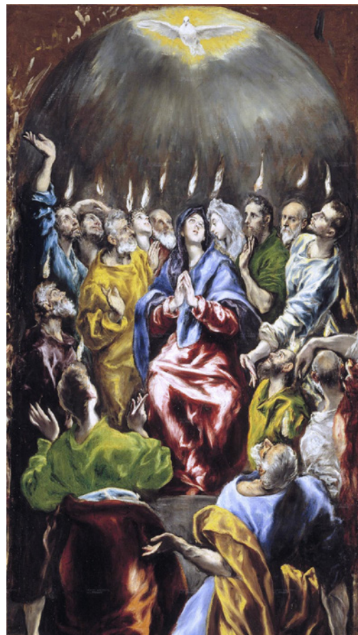
〈성령 강림 (부분)〉, 엘 그레코, 프라도 미술관, 마드리드, 스페인

오소서 성령님. 주님의빛 그빛살을 하늘에서 내리소서. 가난한이 아버지, 오소서 은총주님, 오소서 마음의빛. 가장좋은 위로자 영혼의 기쁜손님 저희생기 돋우소서. 일할때에 휴식을 무더위에 시원함을 슬플때에 위로를. 영원하신 행복의빛 저희마음 깊은곳을 가득하게 채우소서. 주님도움 없으시면 저희삶의 그모든것 해로운것 뿐이리라. 허물들은 씻어주고 메마른땅 물주시고 병든것을 고치소서. 굳은마음 풀어주고 차디찬맘 데우시고 빛나간길 바루소서. 성령님을 굳게믿고 의지하는 이들에게 성령칠은 베루소서. 덕행공로 쌓게하고 구원의문 활짝열어 영원복락 주옵소서.