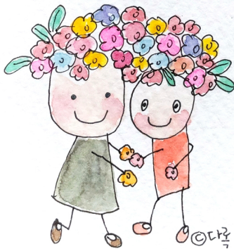
바오로 딸 콘텐츠