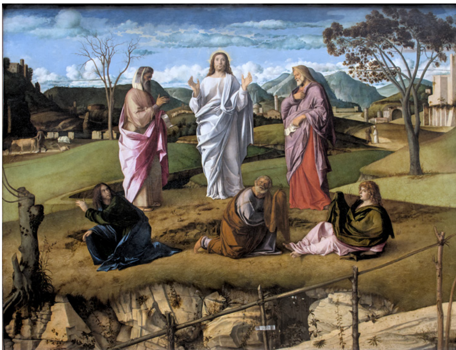
〈그리스도의 변모〉, 조반니 벨리니

“이는 내가 사랑하는 아들이니 너희는 그의 말을 들어라.” 하는 소리가 났다. (마르 9,7)