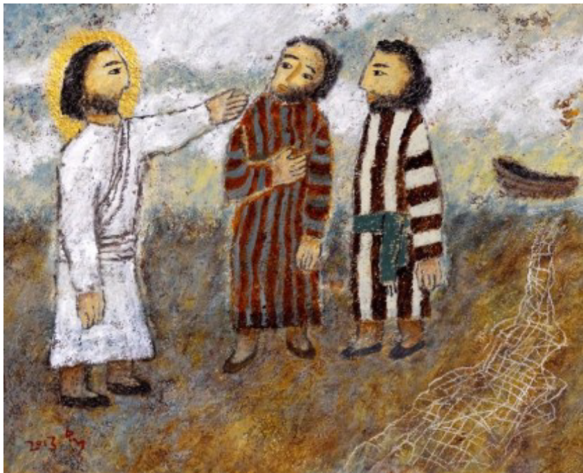
〈나를 따르라〉, 김옥순 수녀 작

“나를 따라오너라. 내가 너희를 사람 낚는 어부가 되게 하겠다.” 그러자 그들은 곧바로 그물을 버리고 예수님을 따랐다. (마르 1,17-18)