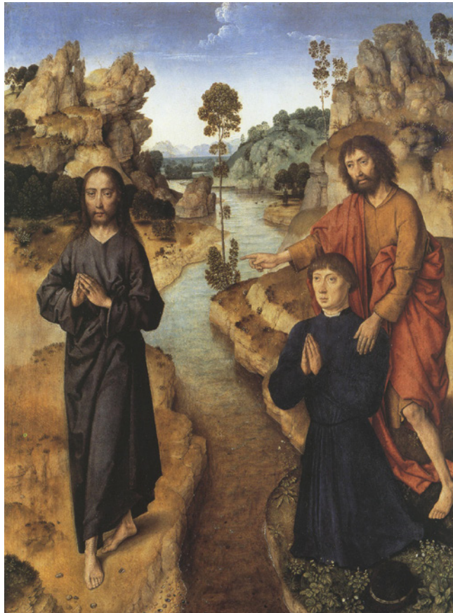
〈보라, 하느님의 어린양〉, 디르크 보우츠