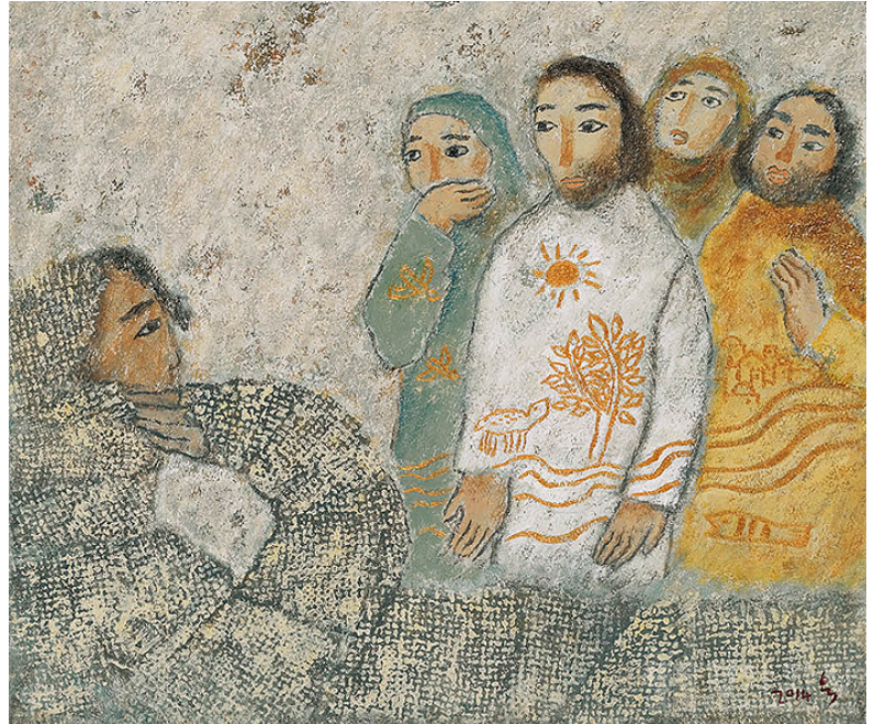
〈라자로야 나오너라〉, 김옥순 수녀 작

예수님께서 이렇게 말씀하시고 나서 큰 소리로 외치셨다. “라자로야, 이리 나와라.” 그러자 죽었던 이가 손과 발은 천으로 감기고 얼굴은 수건으로 감싸인 채 나왔다. 예수님께서 사람들에게, “그를 풀어 주어 걸어가게 하여라.” 하고 말씀하셨다. 마리아에게 갔다가 예수님께서 하신 일을 본 유대인들 가운데에서 많은 사람이 예수님을 믿게 되었다. (요한 11, 43-45)