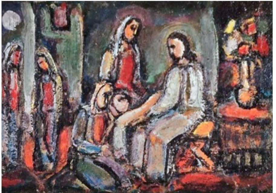
〈마르타와 마리아의 집을 방문한 예수 그리스도〉, 조르주 루오

마르타야, 마르타야! 너는 많은 일을 염려하고 걱정하는구나. 그러나 필요한 것은 한 가지뿐이다. 마리아는 좋은 몫을 선택하였다. 그리고 그것을 빼앗기지 않을 것이다. (루카 10,41-42)