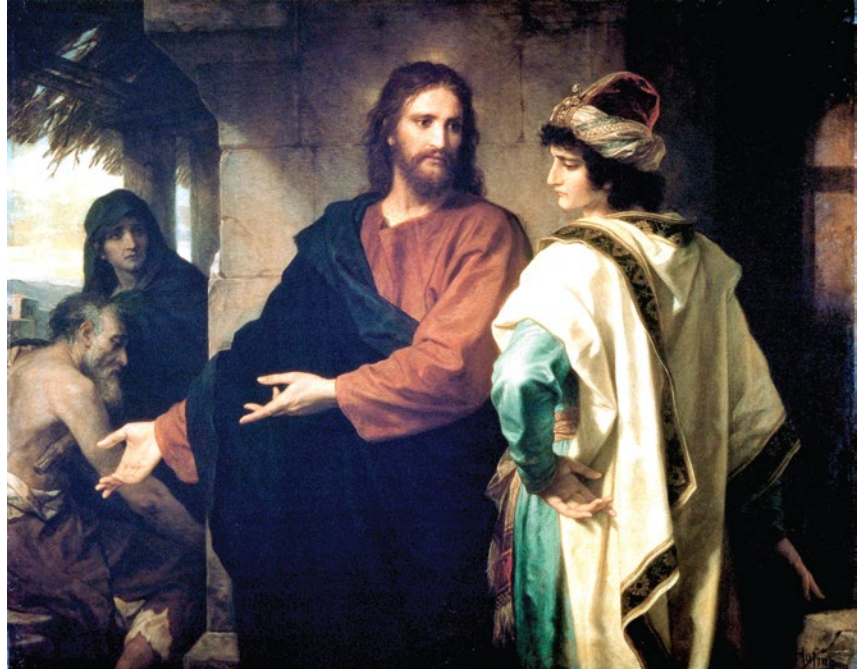
〈그리스도와 부자 청년〉, 하인리히 호프만

예수님께서서는 그를 사랑스럽게 바라보시며 이르셨다. “너에게 부족한 것이 하나 있다. 가서 가진 것을 팔아 가난한 이들에게 주어라. 그러면 네가 하늘에서 보물을 차지하게 될 것이다. 그리고 와서 나를 따라라.” 그러나 그는 이 말씀 때문에 울상이 되어 슬퍼하며 떠나갔다. 그가 많은 재물을 가지고 있었기 때문이다. 〈마르 10, 21-22〉