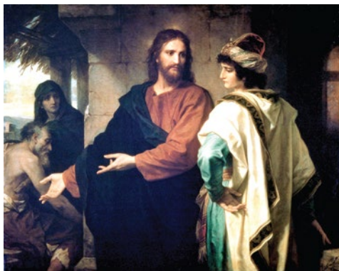
<그리스도와 부자 청년>, 하인리히 호프만

부자이면서 인색한 사람이 성경(마태오 19,16-26; 마르코 10,17-27; 루카 18,18-27)에 나오고, 이 성경을 배경으로 독일화가 하인리히 호프만(Heinrich Hofmann, 1824-1911)은 1889년에 <그리스도와 부자 청년>을 그렸다. 그는 인물화를 주로 그린 화가답게 예수님의 모습에 정성을 들였다.