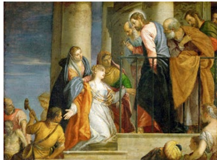
<하혈하는 여인을 고치시는 그리스도>, 파올로 베로네세

화려한 색채로 16세기 베네치아의 영광을 구현한 파올로 베로네세(Paolo Veronese, 1528-1588)는 1570년경에 <하혈하는 여인을 고치시는 그리스도>를 그림으로 그렸습니다.