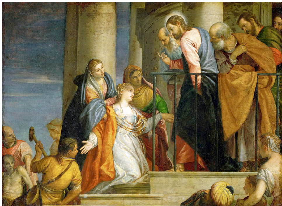
〈하혈하는 여인을 고치시는 그리스도〉, 파올로 베로네세

“딸아, 네 믿음이 너를 구원하였다. 평안히 가거라. 그리고 병에서 벗어나 건강해져라” (마르 5,34)