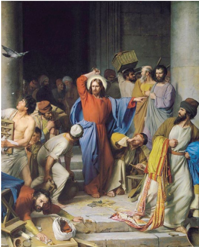
〈성전 정화〉, 칼 하인리히 블로흐

“이 성전을 허물어라. 그러면 내가 사흘 안에 다시 세우겠다.” (요한 2,16.19)