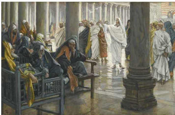
〈율법 학자들과 바리사이들을 꾸짖으시다〉, 제임스 티소트