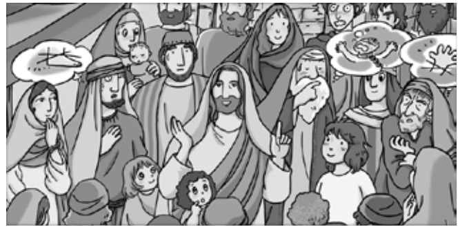
<오마리아 주일복음/바오로딸 콘텐츠>

Jesus says that the Ten Commandments are very important, but we have to do more than just obey them. We need to love! < https://www.thekidsbulletin.com >