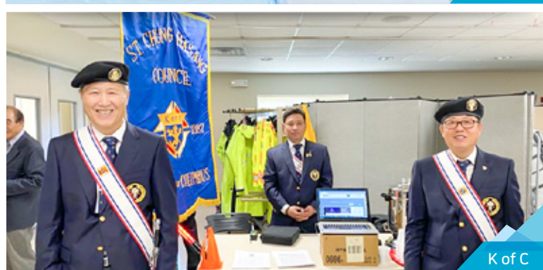
K of C