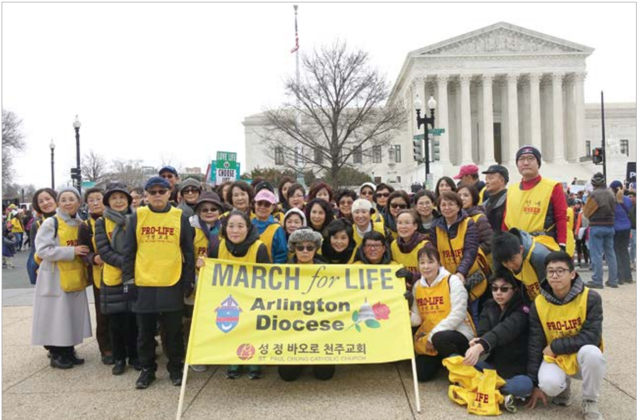
〈2020 생명 수호 행진〉