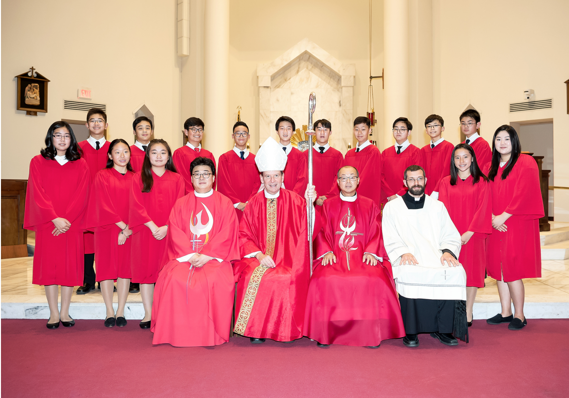
2019년 학생 견진성사