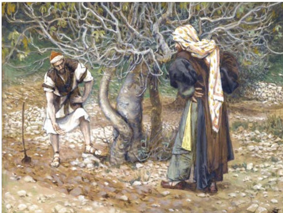
〈The Vine Dresser and the Fig Tree〉, James Tissot(1836-1902), Brooklyn Museum

“주인님, 이 나무를 올해만 그냥 두시지요. 그동안에 제가 그 돌레를 파서 거름을 주겠습니다. 그러면 내년에는 열매를 맺겠지요. 그러지 않으면 잘라 버리십시오.” (루카 13,8-9)