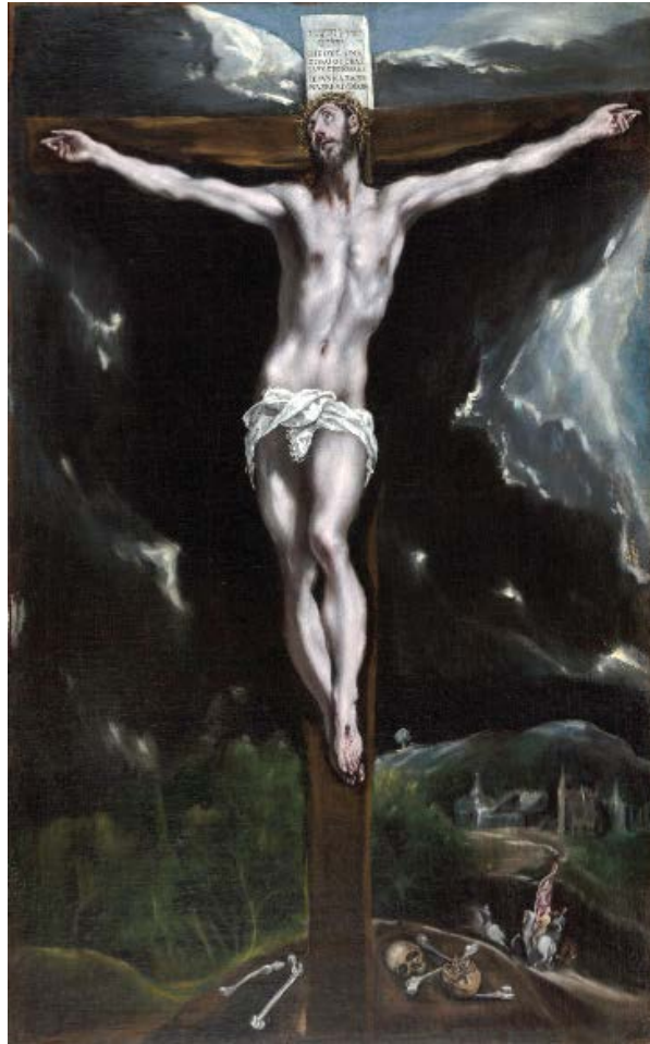
엘 그레코, <Christ on the Cross>, 1600 - 1610, 캔버스에 유채화, 82.6 × 51.8 cm

캘리포니아 LA의 명소 게티 센터는 소더비 경매에서 올드 마스터 엘 그레코(EI Greco, Domenico Theotokopoulos, Greek 1541 - 1614)의 <십자가에 매달린 그리스도 Christ on the Cross>를 2000년도 최고가로 구입하며 컬렉션의 위상을 한껏 높인다. 비정한 수전노라는 수식어가 따르는 석유 재벌 폴 게티의 지갑은 예술품 구입시 아낌없이 열렸고, 1974년 개관한 J. 폴 게티 뮤지엄(J. Paul Getty Museum)에 전시된다. 그의 유언으로 사회에 환원된 재산은 게티 재단을 설립하고 연간 2백만이 넘는 관람객이 무료로 입장할 수 있다. 스페인 가톨릭의 신비주의와 말년의 원숙한 예술적 특성이 과감하게 표출된 화면은, 엘 그레코가 이 주제로 그린 마지막 세 번째 작품이다. 관람객은 어두운 색조의 배경 전면에서 선명하게 두드러지는 유질이 풍부한 그리스도의 형상과 마주한다.