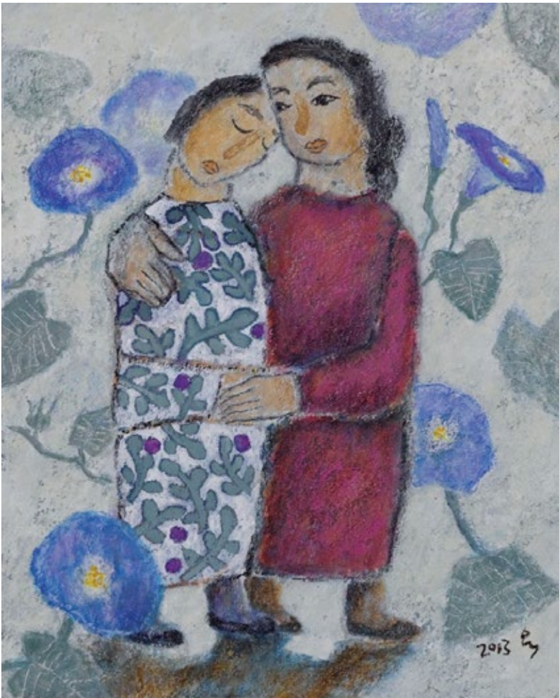
〈우리가 살아가는 기쁨〉 김옥순 수녀 작

너희는 원수를 사랑 하여라. 그리고 너희를 박해하는 자들을 위하여 기도 하여라.” (마태 5, 41-42.44-45)