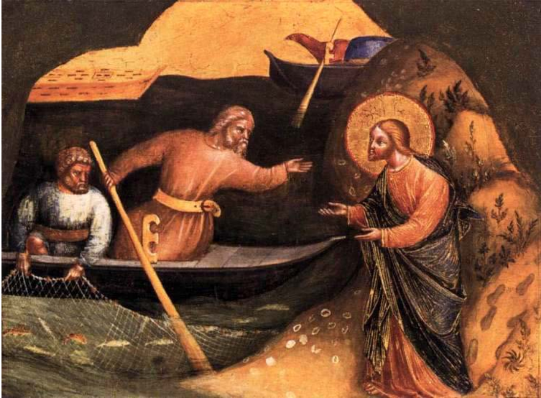
〈사도 베드로와 안드레아를 부르심〉, 로렌초 베네치아노

“예수님께서서는 갈릴래아 호숫가를 지나가시다가 두 형제, 곧 베드로라는 시몬과 그의 동생 안드레아가 호수에 어망을 던지는 것을 보셨다. 그들은 어부였다. 예수님께서 그들에게 이르셨다. “나를 따라오너라. 내가 너희를 사람 낚는 어부로 만들겠다.” 그러자 그들은 곧바로 그물을 버리고 예수님을 따랐다.” (마태 4,18-20)