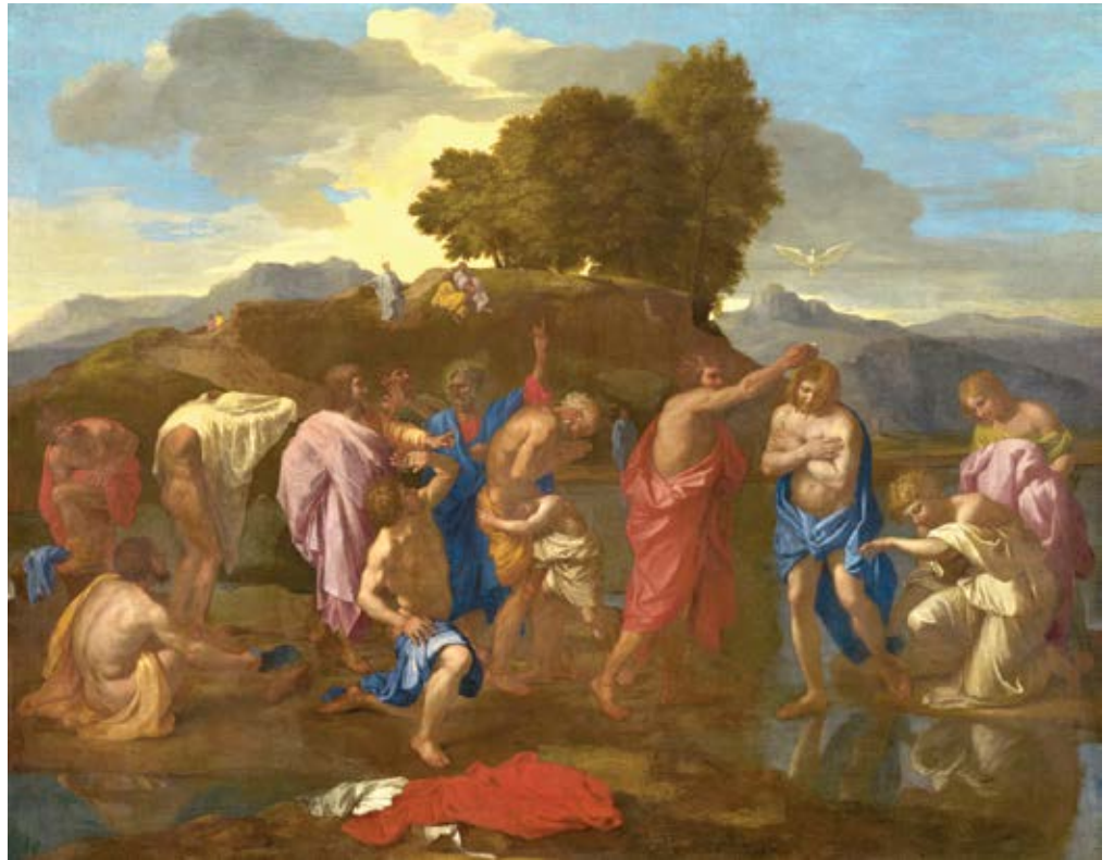
니콜라스 푸생, <그리스도의 세례>, 유채화, 95.5 x 121 cm, 1641/1642

하느님의 음성이 선포되는 찰나적 순간, 세례자 요한 뒤로 선 인물들의 격렬한 표정과 왜곡된 포즈로 푸생은 인간 형태가 지배하는 역사화를 명백히 논증한다. 그는 그리스도를 하느님의 아들로 인정하는 두려움에 찬 인물들의 반응을 복잡한 자세와 감각적 몸짓으로 제시해 그림 속 관람자로서의 존재를 환기시킨다. 신비로운 역사적 사건에 동참하는, 화면을 짝 채운 인물은 무대에서 내러티브를 상연하는 배우처럼 움직임, 표정,