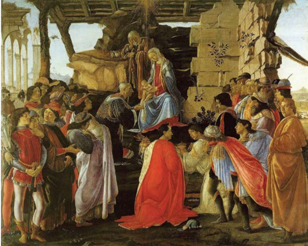
〈동방박사의 경배〉, 산드로 보티첼리

“그들은 그 별을 보고 더없이 기뻐하였다. 그리고 그 집에 들어가 어머니 마리아와 함께 있는 아기를 보고 땅에 엎드려 경배하였다.” (마태 2,10-11)