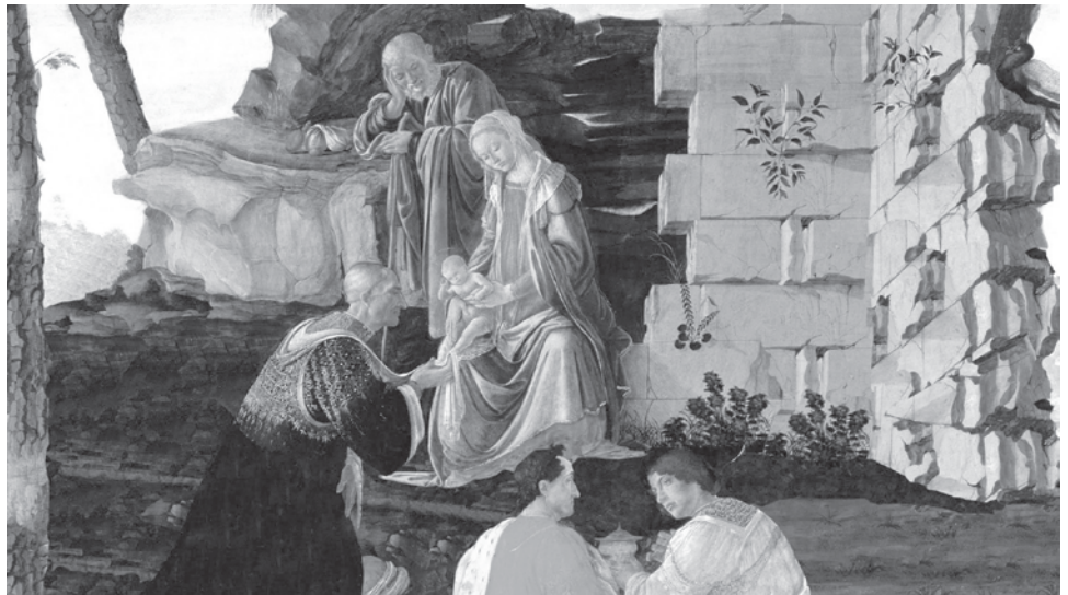
산드로 보티첼리, 동방박사의 경배 (부분)

축일은 1월 6일로 정했으나, 의무적 대축일로 지내지 않는 지역에서는 1월 2일과 8일 사이의 주일로 축일을 지낸다. 제1독서(이사 60,1-6)와 제2독서(에페 3,2-6)는 ‘그리스도께서 이방인의 빛’으로 널리 선포됐다는 점을 전하고 있다. 복음(마태 2,1-12)은 동방박사 3명이 베들레헴을 찾아온 이야기를 전한다. 세 명의 박사(현인 혹은 왕)는 별에 의하여 아기 예수(유다인의 왕)가 탄생한 곳으로 인도되었다(마태 2, 7-8). 그리고 이들은 황금, 유향, 몰약을 예물로 드렸다. 황금은 그리스도께서 하늘과 땅의 왕이심을, 유향은 한