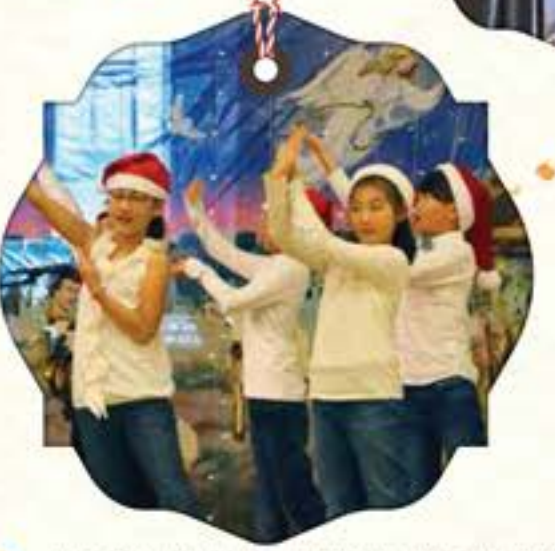
7 TH -GREGORIAN CHANT PUER NATUS IN BETHLEHEM