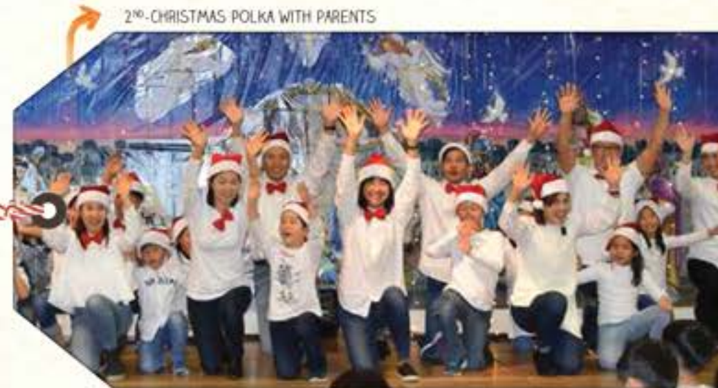
2 ND -CHRISTMAS POLKA WITH PARENTS