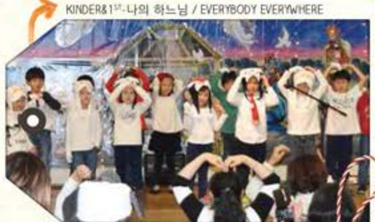
KINDER&1 ST -나의 하나님 / EVERYBODY EVERYWHERE