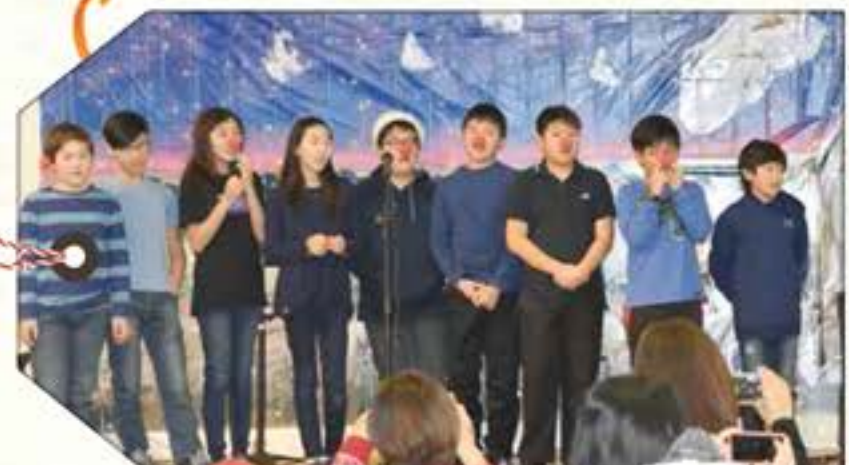
6 TH -WINTER WONDERLAND, RUDOLPH THE RED NOSED REINDEER