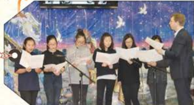
7 TH -GREGORIAN CHANT PUER NATUS IN BETHLEHEM