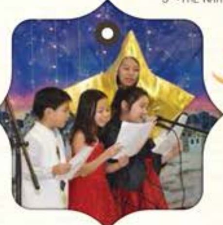
3 RD -THE NATIVITY