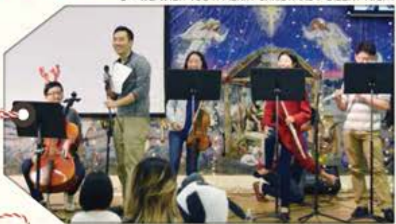
8 TH -WE WISH YOU A MERRY CHRISTMAS / SILENT NIGHT