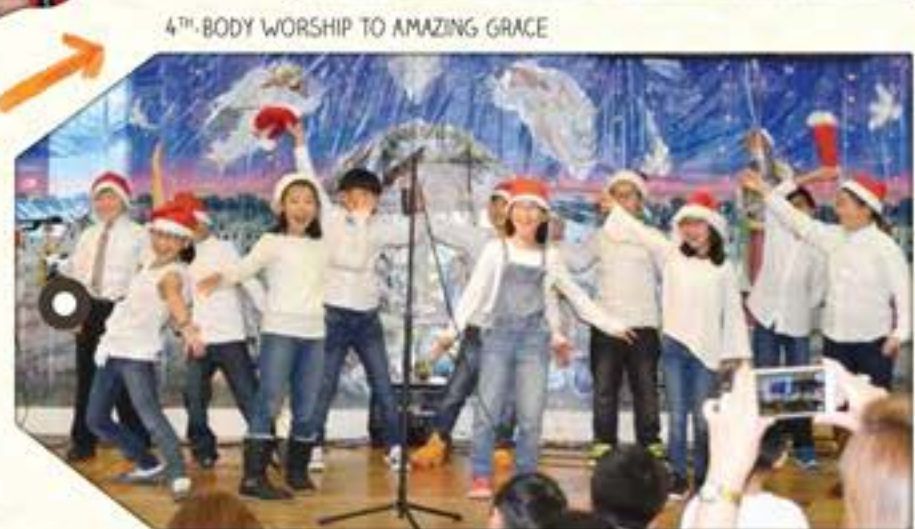
4 TH -BODY WORSHIP TO AMAZING GRACE