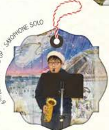
6 TH -YOU RAISE ME UP - SAXOPHONE SOLO