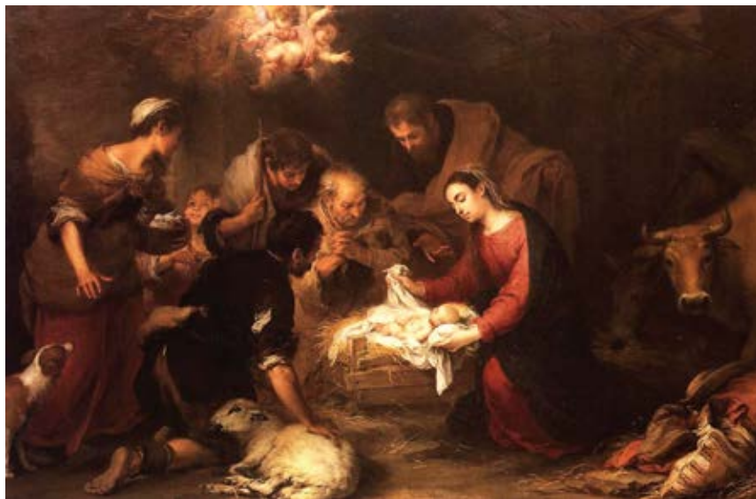
〈목자들의 경배〉, 바르톨로메 에스테반 무리요

다시 한 번 주님의 성탄을 진심으로 축하드리며, 모든 신자 가정에 주님의 축복이 풍성하시길 기도드립니다.