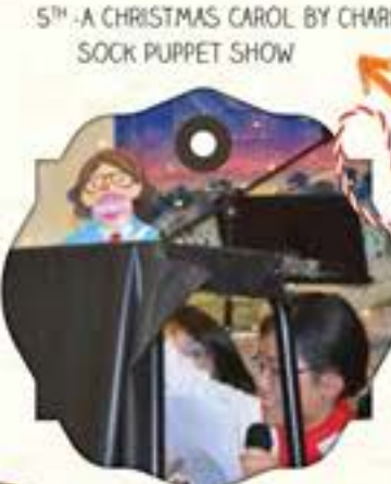
5 TH -A CHRISTMAS CAROL BY CHARLES DICKENS