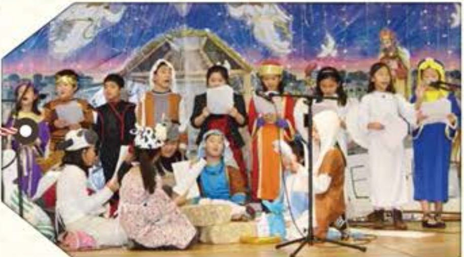
3 RD -THE NATIVITY