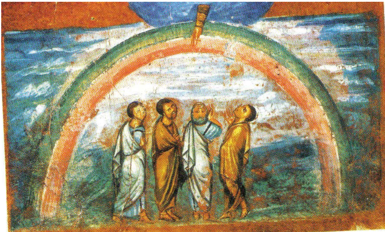
〈하느님과 노아의 약속〉, 6세기, 채색삽화

그러니 깨어 있어라. 너희의 주인이 어느 날에 올지 너희가 모르기 때문이다. (마태 24,37-39.42) ”