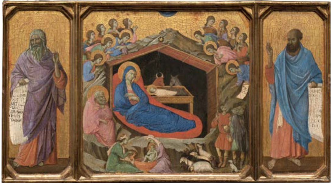
〈선지자 이사야, 에제키엘, 그리스도의 탄생〉 43 × 75.9cm 목판에 템페라 1308-131

두초는 다양한 기독교 도상학적 상징과 내용을 삼입하여 성서 내러티브를 시각언어로 서술한다. 상단 정 중앙의 반원은 천국의 상징으로, 구유 지붕 모서리의 8각 별과 빛은 그리스도에게 인도하는 구원의 길이다. 왼쪽 하단의 개와 양을 동반한 목자들은