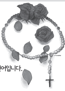
목주기도는 사랑의 언어입니다. - 복사 야고보 알베리네