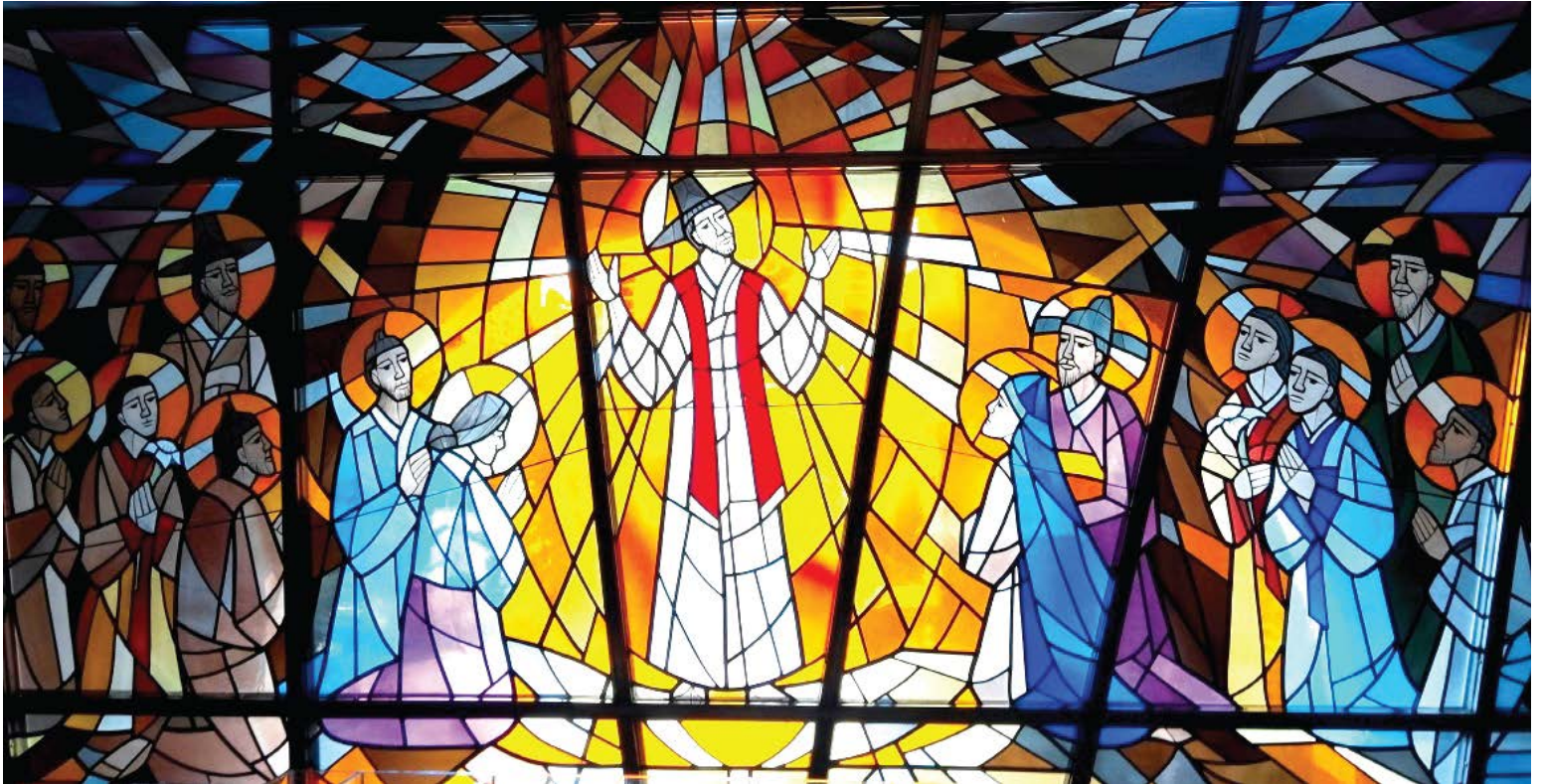
서울대교구 한강 성당, 성 김대건 안드레아 신부와 한국 순교자들, 유리화

“누구든지 내 뒤를 따라오려면, 자신을 버리고 날마다 제 십자가를 지고 나를 따라야 한다. 정녕 자기 목숨을 구하려는 사람은 목숨을 잃을 것이고, 나 때문에 자기 목숨을 잃는 그 사람은 목숨을 구할 것이다. (루카 9,23- 24)”