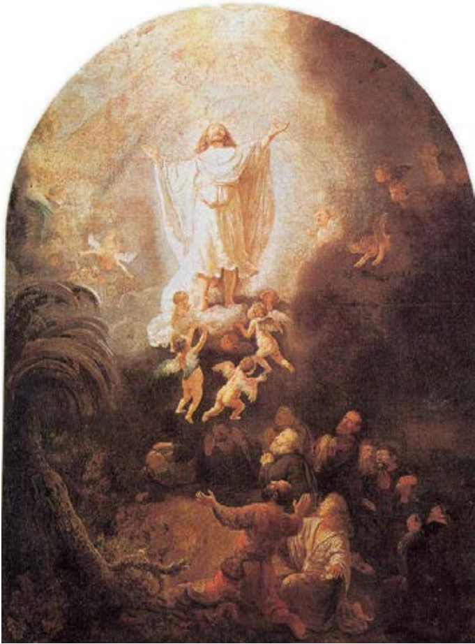
‘그리스도의 승천’, 렘브란트(1606-1669), 피나코텍 미술관, 뮌헨

렘브란트 (Rembrandt, 1606-1669)는 성경을 가장 잘 풀이한 화가다. 그가 1636년에 그린 ‘그리스도의 승천’은 그리스도인의 소망을 일깨워 준 작품이다. 그는 사도행전 1장 6-11절의 말씀을 소재로 그림을 그렸다. 예수님께서서는 제자들에게 땅 끝에 이르기까지 나의 증인이 되라고 이르신 다음 그들이 보는 앞에서 하늘로 오르셨다.